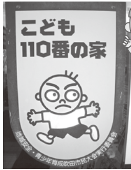
答え：こども110番の家

よ。や、プレートが目印だ 店があるよ。黄色い旗 に、かけこめるお家やお ルで助けを求めたい時 こどもたちが、トラブ