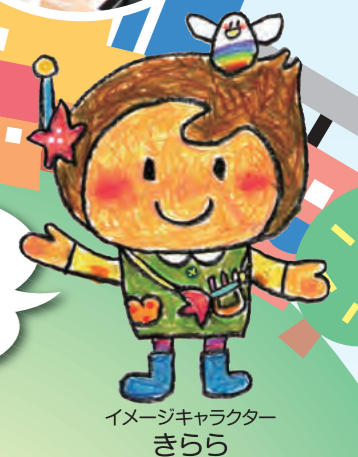
イメージキャラクター きらら

社会福祉協議会(社協)は、 いろいろな人と「みんなで助け合える まちづくり=地域の福祉活動」を すすめる団体です。