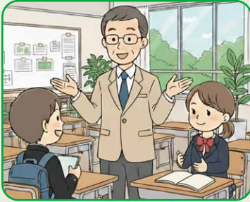
吹田市の相談窓口