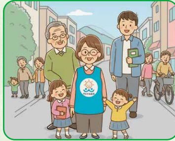
図書館や児童館などの職員さん