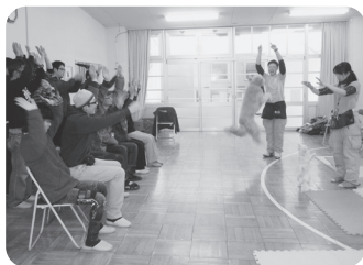
かわいい〜♪ (ワークセンターくすの木にて)

ン・佐井寺地区福祉委員会の皆さんが参加してくれました。2頭のセラピードッグとゲーム等を通して楽しいひとときを過ごしました。参加者からは「犬が苦手でしたが、癒されました」と喜びの声を聞くことができました。体験後の茶話会では、参加者の皆さんで和やかにおしゃべりしながら、交流しました。