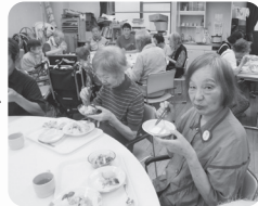
デイでの昼食も夕食のお弁当も楽しみ

お弁当は、デイサービスの厨房で調理しており、バランスのとれたメニューです。(1食540円)利用者さんからは「おいしいよ!」と大好評です。