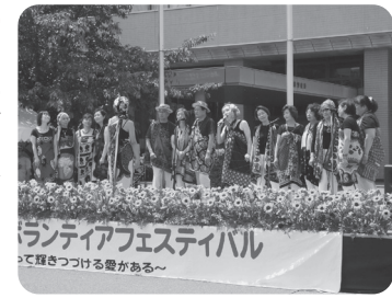
昨年のフェスティバルの様子

平成27年5月31日(日)、午前10時～午後3時まで吹田市役所駐車場にて開催します。